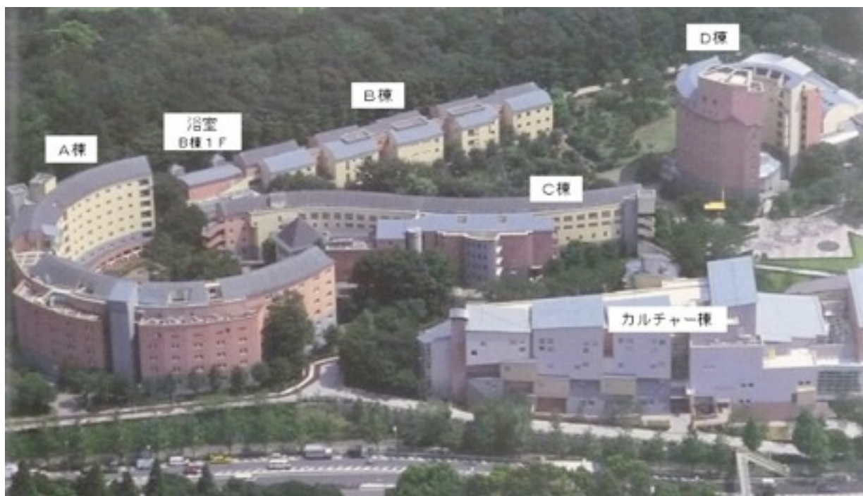
宿泊棟全体図

部屋割は1人1部屋の個室ですが、宿泊A棟はさらに10人か20人のユニットごとに仕切られており、トイレとお風呂をユニット内の人同士で使用します。お風呂は一度に3～4人程度入ることができると思います。個室内では飲食が禁止されているので、各ユニットに1つずつある「談話コーナー」で飲食を行うようにしてください。談話コーナーにはテレビもあるので、その日に撮影したビデオを鑑賞することもできます。