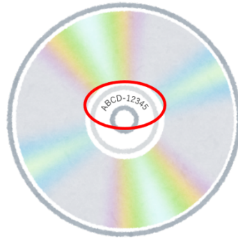
図：規格品番の記載例（ABCD- 12345が規格品番）

レコード会社によって出版されたCDの音源を利用する場合は規格品番（別名：商品番号、レコード番号、カタログ番号等）を、市販のCDよりコピー・ダビングされた楽曲の場合は録音許諾番号を提出すること。ただし、中古のCDは使用可能であるが、レンタル用CDは使用不可である。規格品番の番号が記載されている場所の例を以下の図に示す。